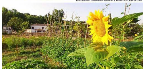
LA HUERTA, UN PROYECTO COMÚN