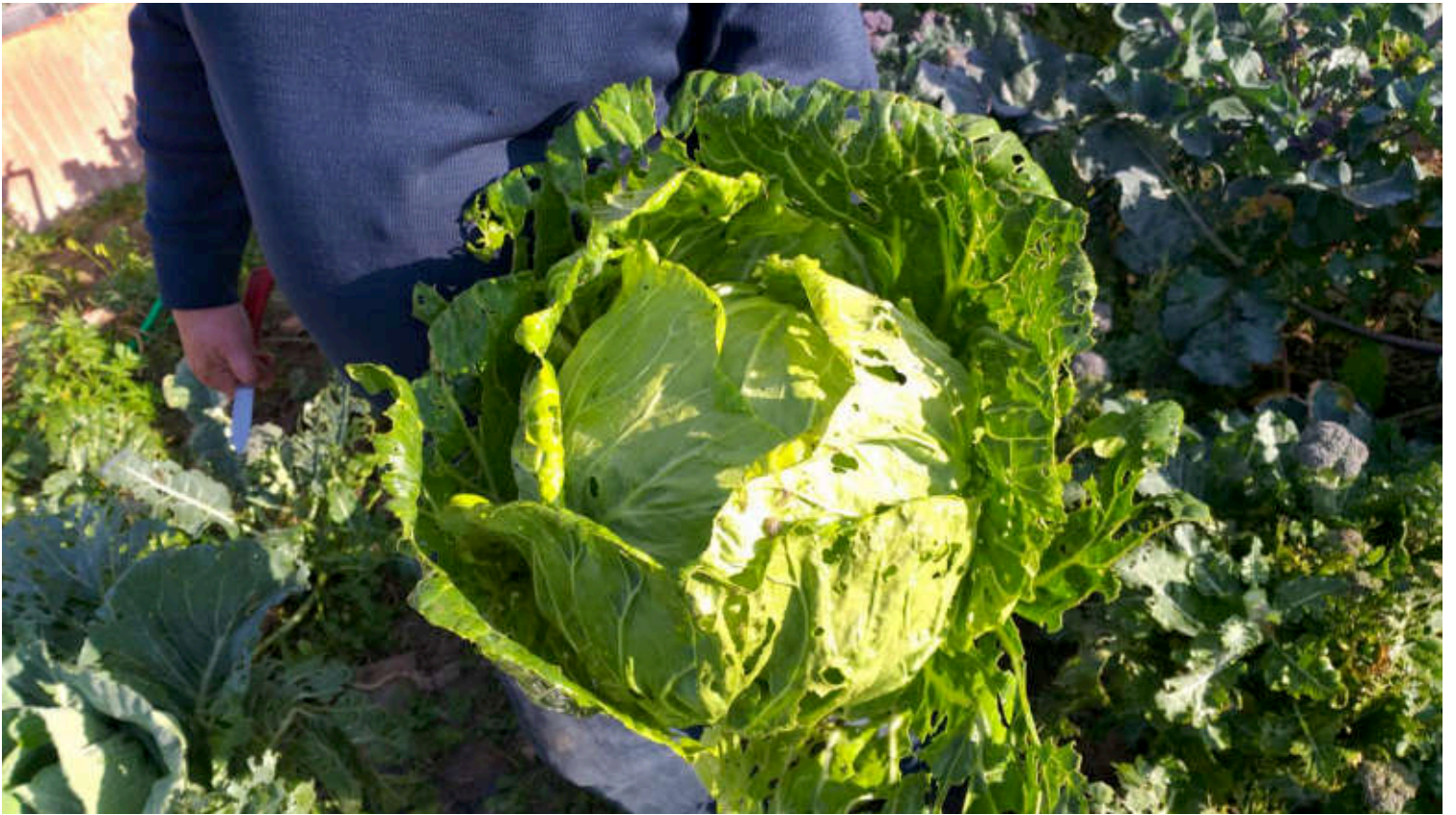
FOTO MOSTRANDO LA CANTIDAD DE CARACOLES Y BABOSAS EN EL INTERIOR DE LA COL