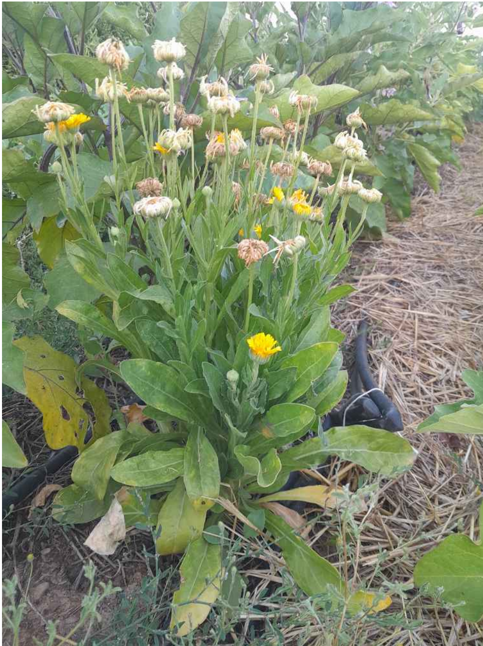
Caléndula naranja y amarilla de la Asociación Fuenserena en Palma del Río (Córdoba)