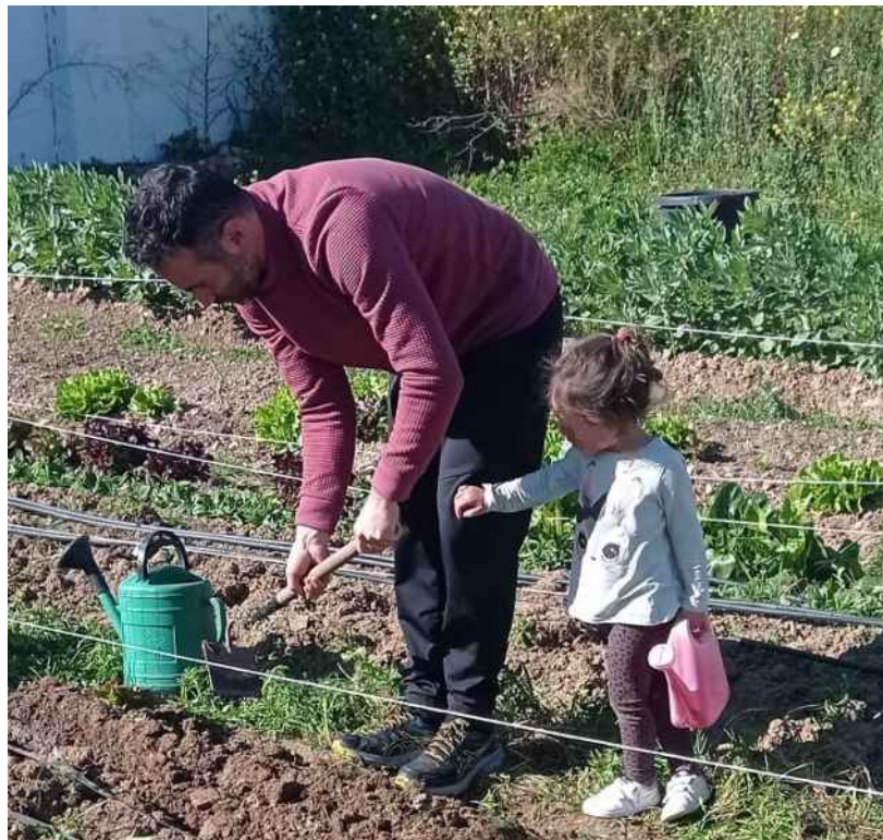
Huerto de invierno en Palma del Río (Córdoba)

Se ha recibido respuesta por parte 9 participantes de Adra (Almería), Córdoba, El Castillo de las Guardas (Sevilla), El Viso del Alcor (Sevilla), Elne (Francia), Jerez de la Frontera (Cádiz), Jabugo (Huelva), Palma del Río (Córdoba) y San Silvestre de Guzmán (Huelva). Los datos hay que interpretarlos como un retrato puntual de la situación de las variedades y los huertos en el momento en el que cada participante cumplimentó al cuestionario. Además de responder al cuestionario, en algunos casos han remitido imágenes mostrando la situación de los cultivos y también, desde el Colectivo Ecopacifista Solano, fichas con los resultados de las variedades de otoño-invierno que se les remitieron en 2022 como obsequio de bienvenida que se incluyen al final del informe.