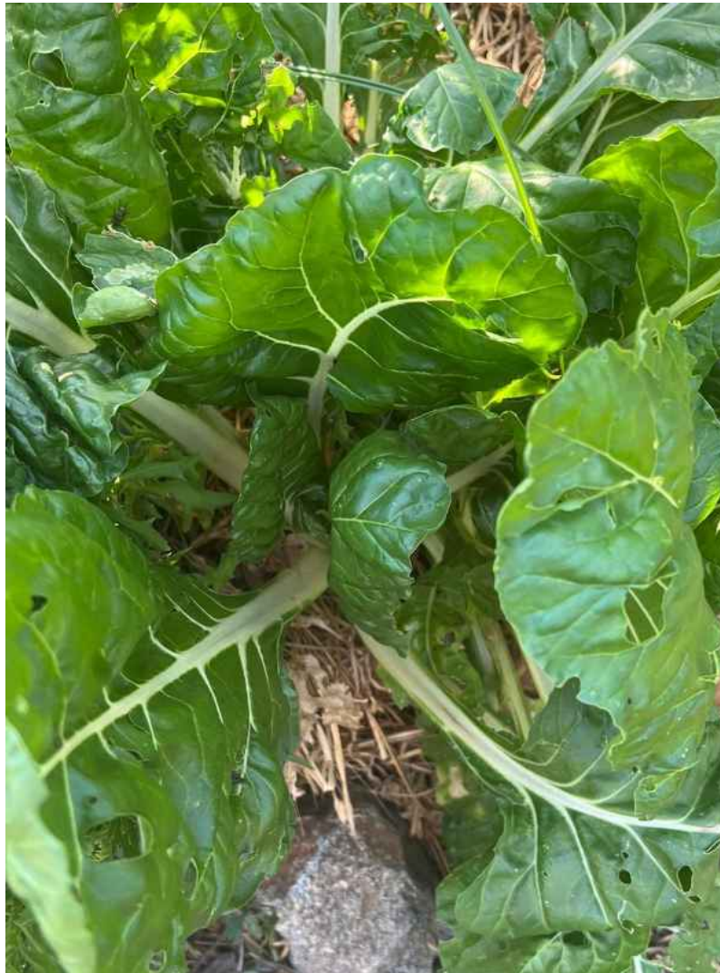
Acelga blanca de Bollullos de la Mitación en El Castillo de las Guardas (Sevilla)

En esta campaña se intercambiaron 107 muestras de semillas, de las que 55 fueron entradas y 52 salidas. Entre las entradas se recibieron semillas de 55 variedades de 26 cultivos diferentes. Por parte de la Red Andaluza de Semilla se remitieron 39 variedades de 24 cultivos. En total tuvo 9 participantes, de las cuales eran 4 agricultoras, 4 agricultores y 1 centro educativo.