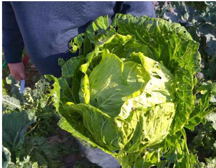
Col de los Llanos de Coin en El Viso del Alcor (Sevilla)

Se apadrinaron 56 muestras de semillas correspondientes a 51 variedades de 23 cultivos diferentes. En total tuvo 6 participantes, de las cuales eran 5 agricultores y 1 agricultora.