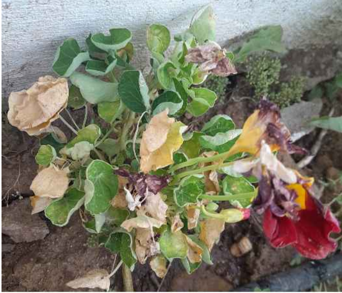
Capuchina mezcla de semillas de flores naranjas, rojas y amarillas de Bollullos de la Mitación en Palma del Río

La resiembra e intercambio de variedades locales de cultivo la llevan realizando los agricultores y agricultoras desde tiempos ancestrales. Esta acción ha sido restringida, y prohibida en algunos casos, en las últimas décadas por parte de las leyes de semillas y la imposición de una agricultura, distribución y alimentación industrial y multinacional. Pero, a pesar de ello, muchos agricultores, agricultoras y redes de semillas han persistido y luchado por su derecho de resembrar e intercambiar sus propias semillas.