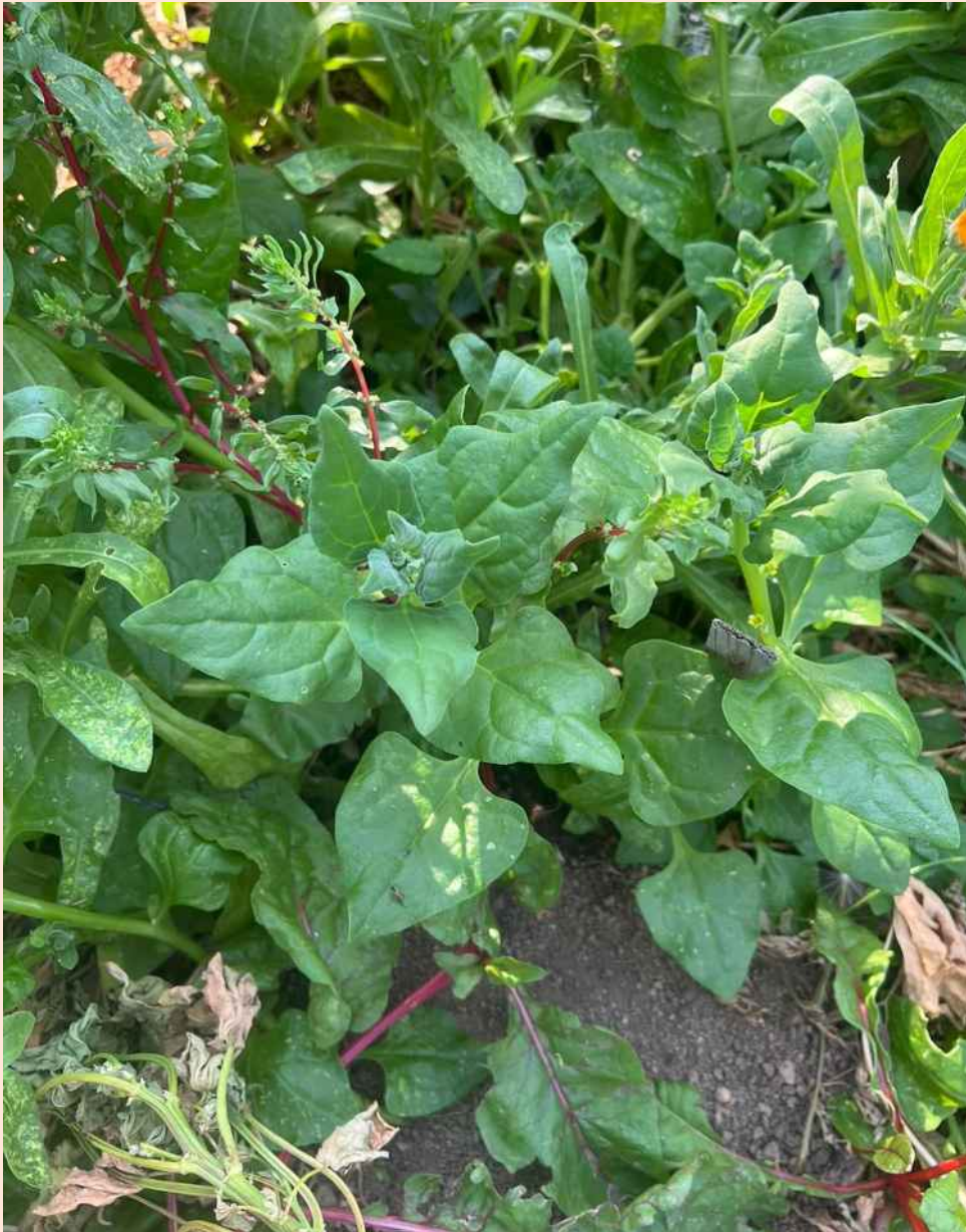
Espinaca pinchúa de La Indiana de Ronda en El Castillo de las Guardas (Sevilla)

Red Andaluza de Semillas “Cultivando Biodiversidad” (RAS)